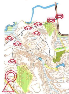
17.04 Кросс деревня Соха Координаты: 57.814653, 27.901746